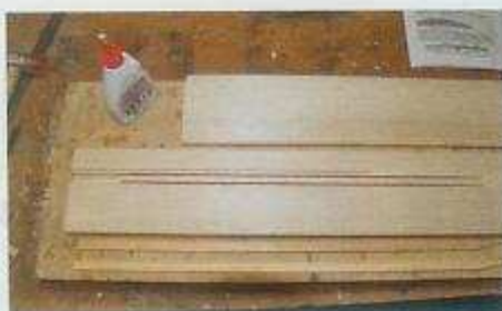
In die profilierten Balsabretter der Tragflächen sind passgenaue Nuten eingefräst. Darin werden die Holme aus Kiefernleisten hochkant eingeleimt.