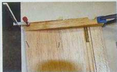
Der richtige Winkel zwischen Profilibrett und Endfahne wird durch die Wurzelrippe hergestellt. Dazu ist das Kiefernformteil entsprechend profiliert.