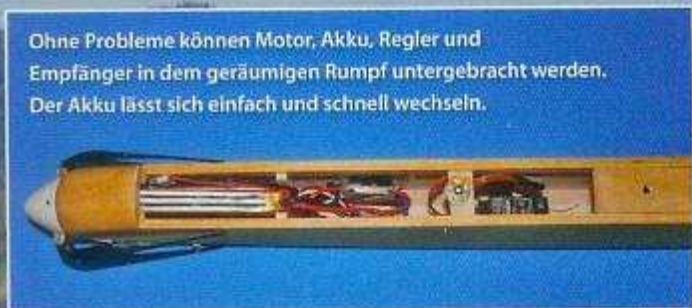
Ohne Probleme können Motor, Akku, Regler und Empfänger in dem geräumigen Rumpf untergebracht werden. Der Akku lässt sich einfach und schnell wechseln.