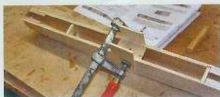
Aus Balsabrettern und Kiefernleisten entsteht der stabile Ximango-Rumpf.